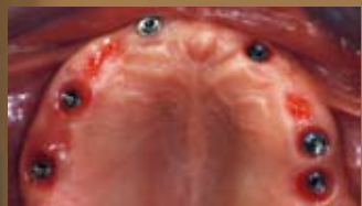
INSERIZIONE DEI 6 IMPIANTI