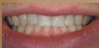
DOPO TRATTAMENTO ORTODONTICO IMPLANTARE E PROTESICO