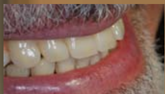
SORRISO A TRATTAMENTO ULTIMATO