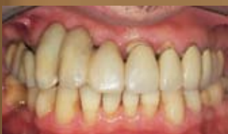
VECCHIA RICOSTRUZIONE PROTESICA