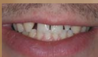
SORRISO PRIMA DEL TRATTAMENTO