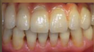
PROTESI PROVVISORIA SU IMPIANTI