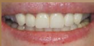
DOPO TRATTAMENTO CHIRURGICO E PROTESICO