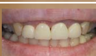
SORRISO PRIMA DEL TRATTAMENTO